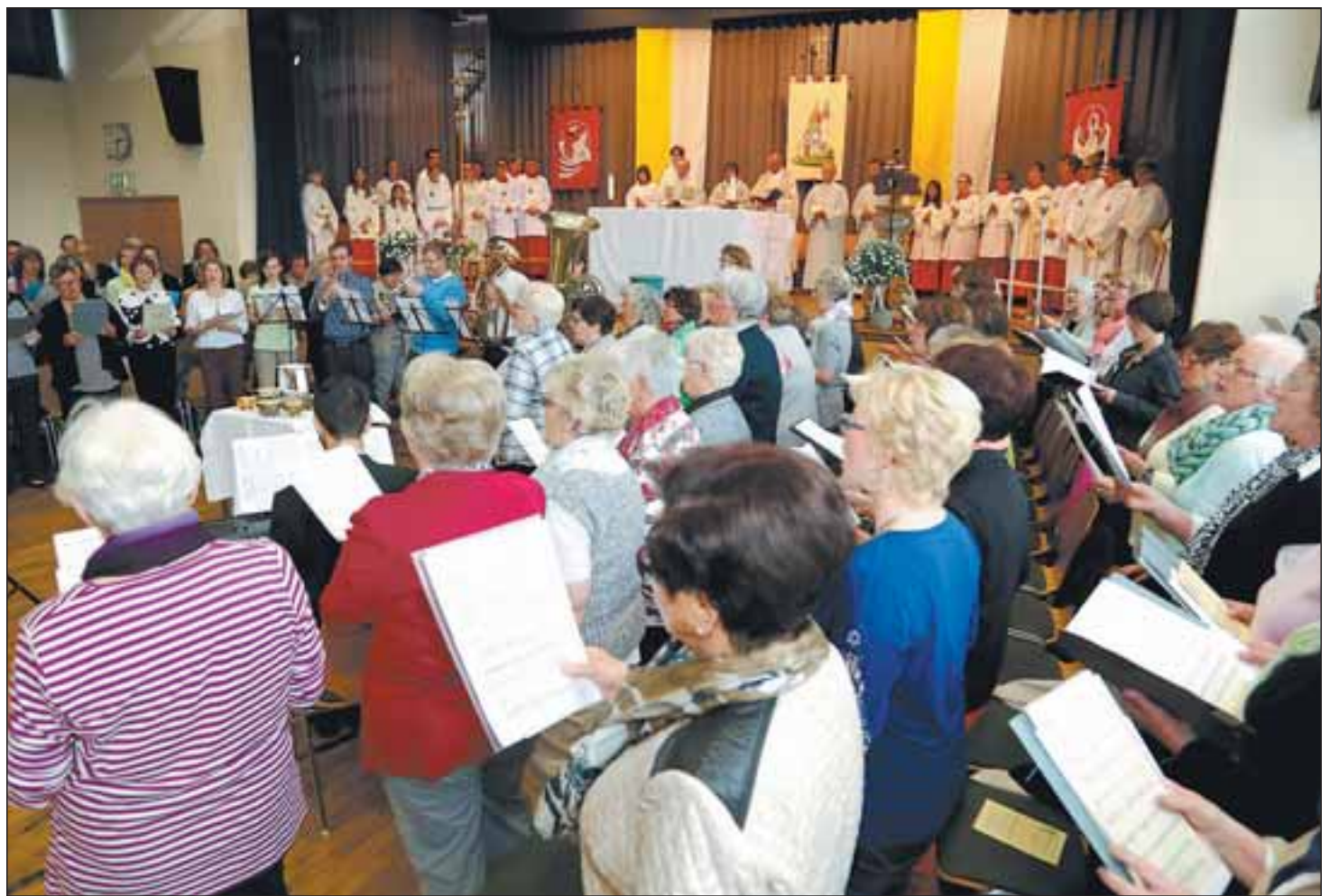
„Lobt den Herrn der Welt“ intonierten die sechs Kirchenchöre der neuen Seelsorgeeinheit Letzenberg, als kürzlich in der Letzenberghalle Malsch vor 500 Gläubigen der konstituierende Gottesdienst stattfand.

100 nach Christus „die Kirche Gottes, die Rom als Fremde bewohnt, an die Kirche Gottes, die Korinth als Fremde bewohnt“. Dies spende Trost für die heutige Zeit, in der Pfarreistrukturen in immer größer werdenden Einheiten immer durchlässiger würden. Der Brief der Urpfarreien mache aber auch deutlich, dass diese Durchlässigkeit schon immer war: daneben zu liegen, nur begrenzt Heimat zu haben, ständig abrufbereit zu sein, sich immer auf einen Exodus zu bewegen. Jede Pfarrei soll ein Ort sein und bleiben, der Frucht bringt, aber kein Ort sein, der nur um des Bestandes Willen an Altmen festhalte, so Pfarrer Viedt.