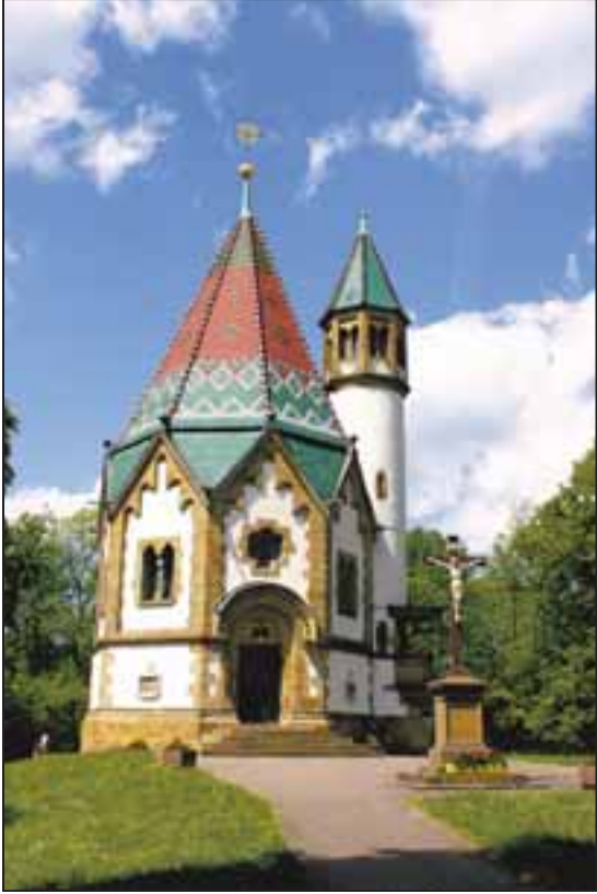
Die Kapelle auf dem Letzenberg ist das weithin sichtbare Wahrzeichen der neuen Seelsorgeeinheit, die sich jetzt konstituierte.

Diese Thematik griff Pfarrer Viedt in seiner Ansprache auf. Der Einzelne bringe, wie die Rebe nur reiche Frucht, wenn er am Weinstock bleibe. Dies gelte für die einzelnen Gläubigen genauso wie für die einzelnen Pfarrgemeinden. Der Mittelpunkt der Pfarrei bilde die Feier der Eucharistie und damit das Eschaton, die prophetische Lehre von den Hoffnungen auf Vollendung. „Pfarrei“ bedeute ursprünglich im Griechischen „daneben wohnen“ und so richtet sich bereits im Clemensbrief rund