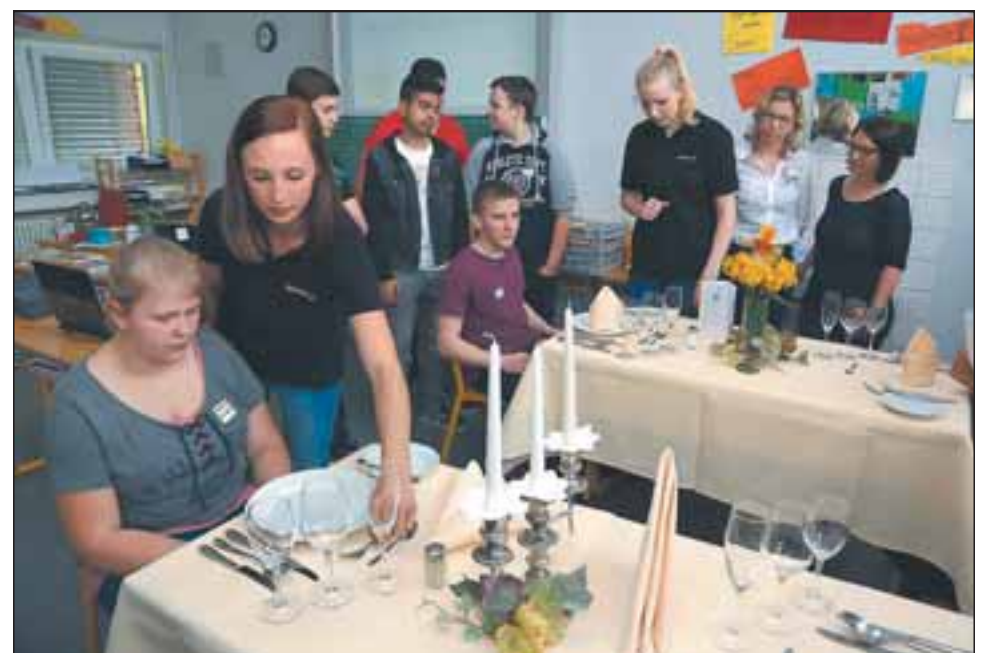
Unter anderem konnten die Schüler beim „Tag der Berufsorientierung“ in Mühlhausen erleben, wie in der Gastronomie ein Tisch richtig gedeckt wird.

Die Heidelberger Druckmaschinen kooperieren seit vielen Jahren mit der Kraichgauschule. Insbesondere die Schüler profitieren von dieser Zusammenarbeit zwischen Schule und Unternehmen, weil sie damit wirklichkeitsnah die Anforderungen der Arbeitswelt kennenlernen, dabei wichtige Erfahrungen sammeln und nützliche Kontakte für die spätere Aufnahme einer Ausbildung knüpfen können. Wichtige Voraussetzungen sind Teamfähigkeit, organisatorisches Geschick, Verantwortungsbewusstsein und technisches Grundwissen.